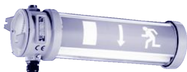
ЕЕ 11 PL с пиктограммой LWRI